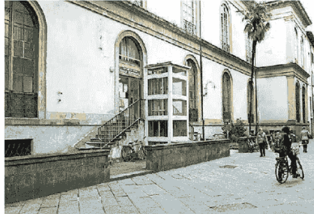
La sede dell'anagrafe si sposterà dentro l'ex Manifattura