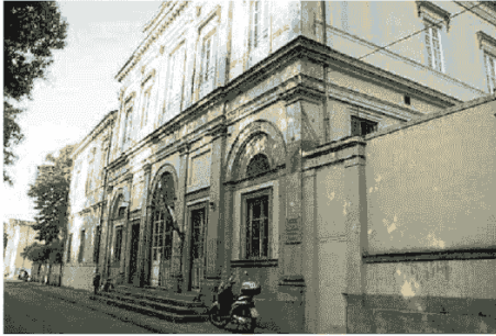
Il comando della polizia municipale lascia piazzale San Donato