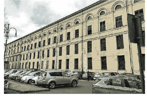
Il 16 marzo all'asta un edificio dell'ex Manifattura: prezzo 5 milioni