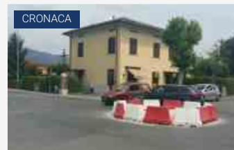
Incidenti, rotatoria di via dei Bocchi nel mirino